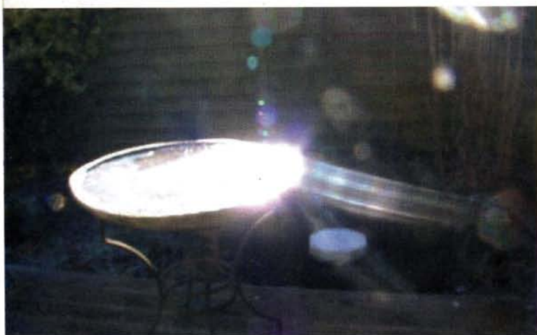
Eine mit Wasser gefüllte Vogeltränke und die schnell vibrierenden kosmischen Energien