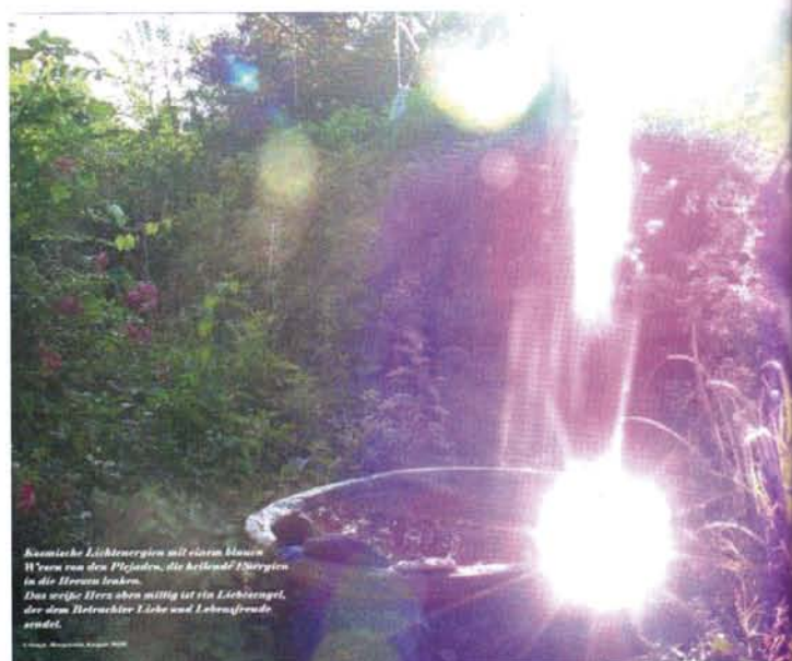
Hier zeigt sich ein blaues Wesen von den Plejaden. Das weiße Herz ist ein Liebesengel

Es zeigen sich jedoch nicht nur die un-heil-vollen Energien, die, die noch nicht geheilt wurden, es zeigen sich auch die lichtvollen Helfer anderer Dimensionen: En-