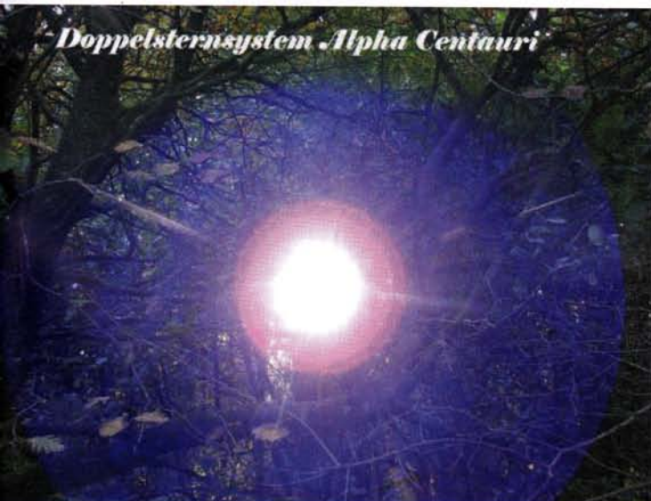
„Doppelsternsystem Alpha Centauri“