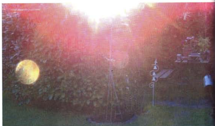
Goldener dreidimensionaler Orb mit der Energie von Erzengel Metatron

gelwesen aus feinstofflichen Welten, Sternensysteme, Orbs, Wesen anderer Planeten, die uns Zuversicht und Trost, Heilung und Hilfe anbieten, die für uns erstrahlen, um schließlich uns, das menschliche Kollektiv zur Erleuchtung zu begleiten?